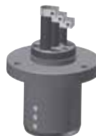
Messen auf mehreren Ebenen Multi-level gauging