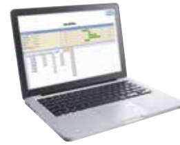
PC / Notebook PC / notebook