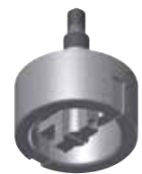
Messen des Außendurchmessers Measuring of the outer diameter