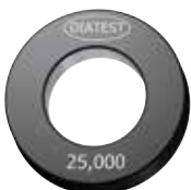
DIATEST Einstellring (Werksnorm) DIATEST setting ring (company standard)