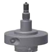
Tiefenanschlag Depth Stop