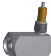
Winkelstück Right-angle attachment