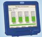
Netzwerkfähiger Messrechner mit Speicher- und Statistikfunktion network-compatible measuring computer with storage functions and statistical analysis