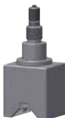
Wellenmessung Shaft measurement