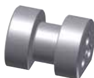
Einstellmeister Wellenmessung Setting master for shaft measurement