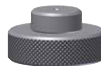
Einstellmeister für Außenmessung Setting master for measuring outer diameters