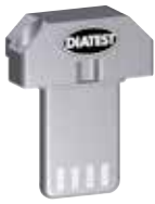
Echtfunksender Radio transmission module

BMD are self-indicating, self-centering measuring instruments for internal and external measurements with highest precision of up to <math>< 1\mu\text{m}</math>. This easy-to-use gauge is suitable for a wide range of application.